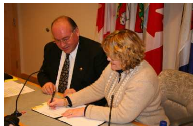
L'honorable Bob McLeod et l'honorable Diane Ablonczy

Le 21 février 2008, l'honorable Diane Ablonczy, secrétaire d'État (Petite entreprise et Tourisme), au